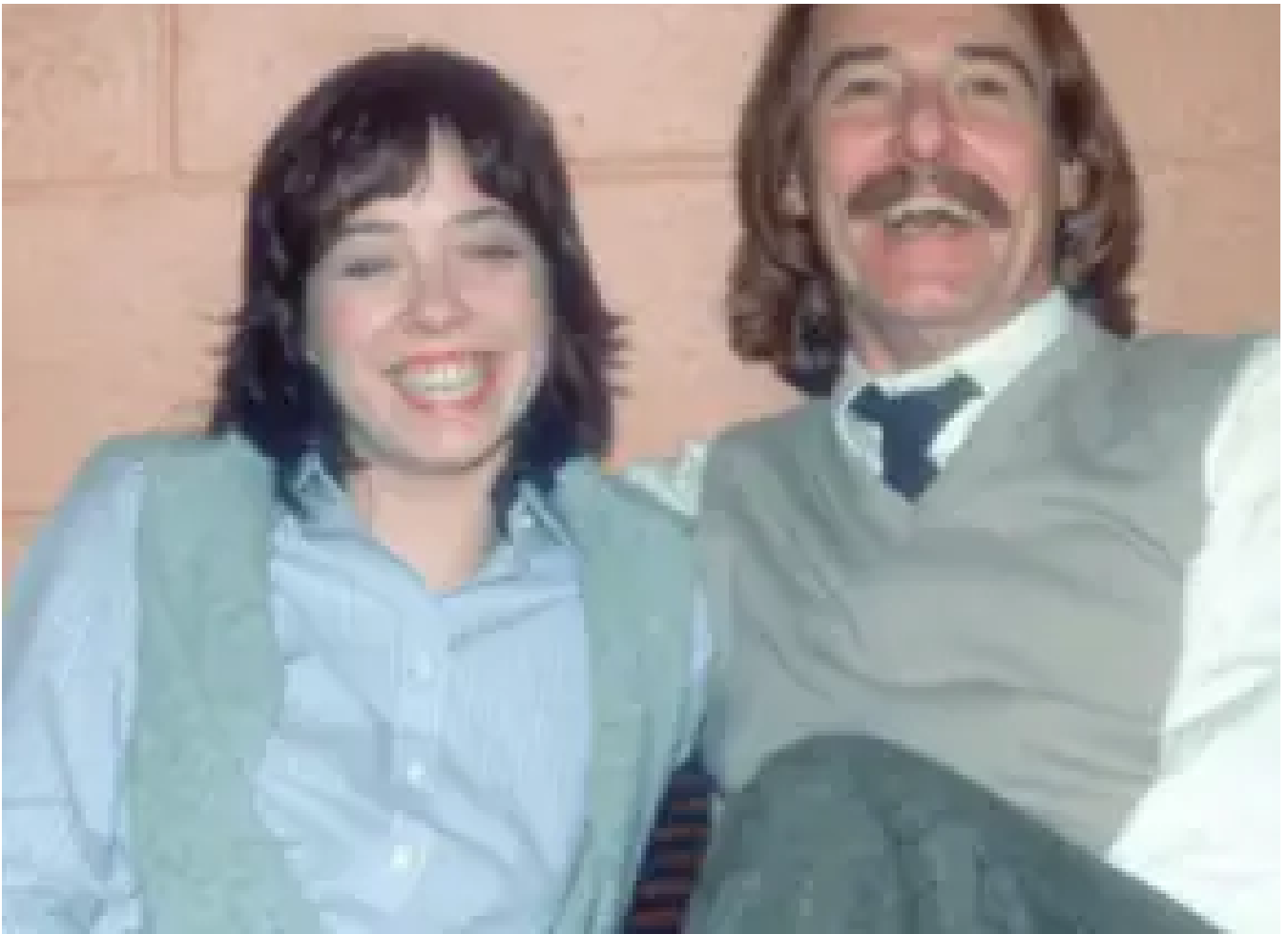
Fruta Prohibida: Seis impactantes historias de incesto de la vida real a lo largo de la historia Tendencia en ATI